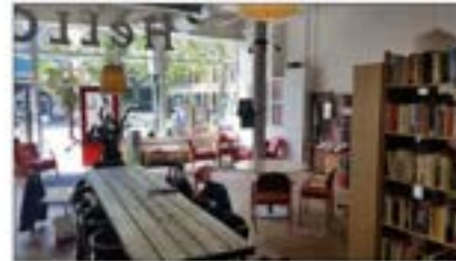
Rotterdam voorbij discriminatie