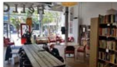
Rotterdam voorbij discriminatie