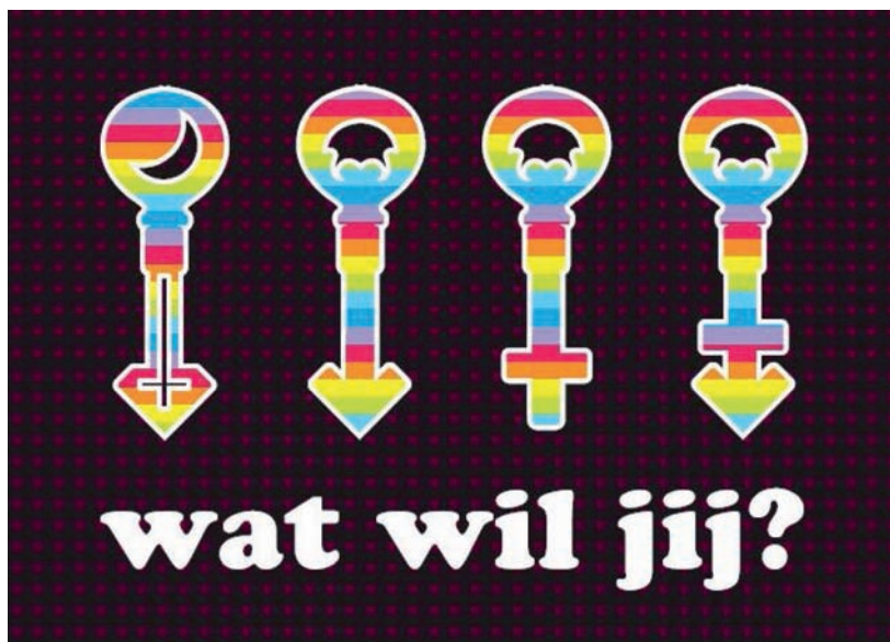
Figuur 2.1 De flyer; Wat wil jij?

Om potentiële kandidaten van zoveel mogelijk informatie te voorzien, heeft gedurende het onderzoek informatie op de website van RADAR gestaan. Hierin stond het doel van het onderzoek beschreven, als ook informatie over het verloop van een interview en het vertrouwelijke karakter van het onderzoek. In bijlage 1 is deze informatie na te lezen.